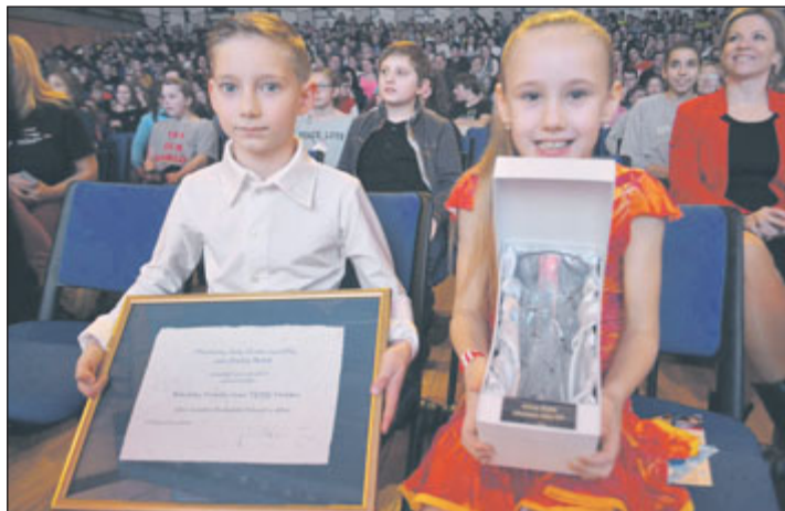
TYMY získalo putovní pohár premiéra ČR Andreje Babiše.