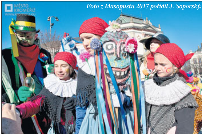
Foto z Masopustu 2017

Nabízí umělou ledovou plochu, kterou můžou návštěvníci využít buď aktivně (bruslení veřejnosti, školka bruslení) nebo pasivně – jako diváci hokejových utkání.