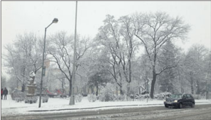
Bezručův park v Kroměříži bude brzy „hlídat“ nová kamera. Ta dále rozšíří kamerový systém, se kterým se v Kroměříži začínalo v roce 2001.