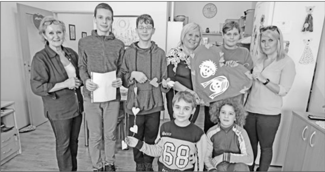
Studenti kroměřížského Arcibiskupského gymnázia vyrobili pro Rodinné centrum Kroměříž srdce ve tvaru draka, protože když si děti pouští draky, jsou šťastné.

V první etapě, která je plánovaná na letošní rok, čeká oprava úsek od obchodního domu Baťa až po křižovatku s ulicími Dobrovského a Farní. Po VaK by od 1. května měla nastoupit plynárenská skupina innogy. Na 1. července je pak plánováno zahájení opravy povrchu ulice, kterou obstará město. Zbýlá část ulice je plánována na rok 2019.