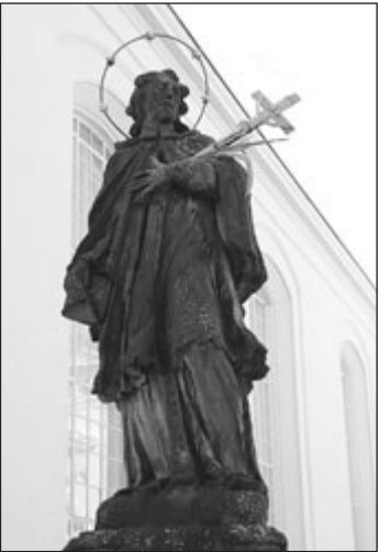
Socha sv. Jana Nepomuckého před vchodem do Květné zahrady v Kroměříži bude restaurována.