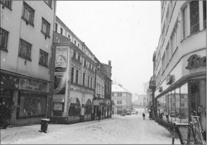
Kroměřížskou Vodní ulici v centru města čekají náročné opravy, které kvůli havarijnímu stavu musí začít dříve.

Bližší informace na www.magicbus.cz nebo tel.: 604 113 400.